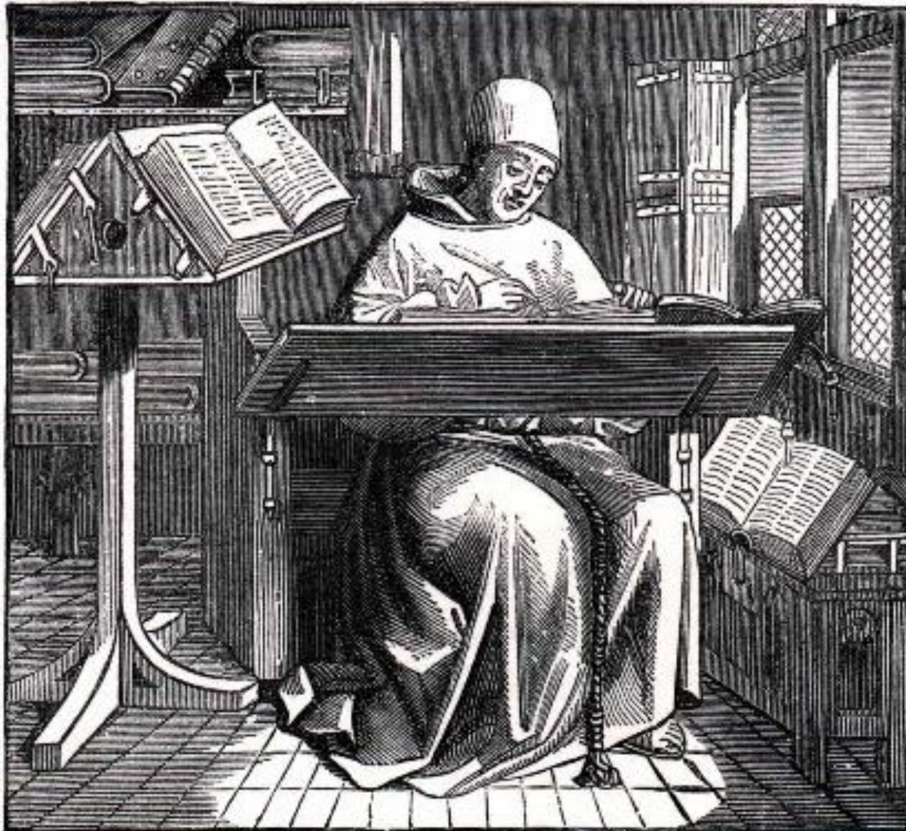
SCRIPTORIUM MONK AT WORK. (From Lacroix .)